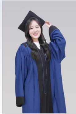
실내프로필 촬영 (20~30분)