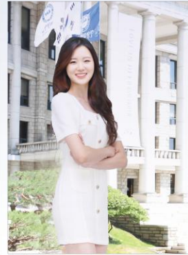
야외프로필 촬영 (20~30분)