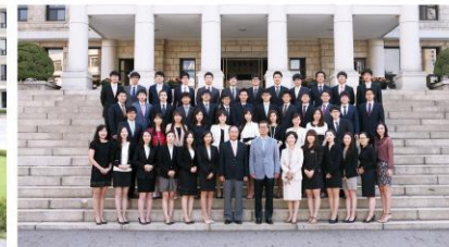
단체사진 (10~15분) 단체촬영을 희망하는 학과 는 9월21일~25일 사이 학과 대표님이 카카오톡 pusannalla 으로 신청