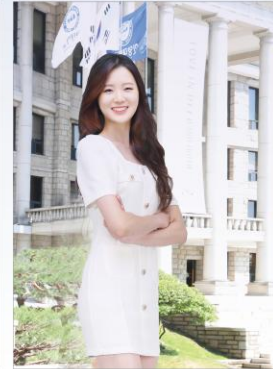
야외프로필 촬영 (20~30분)