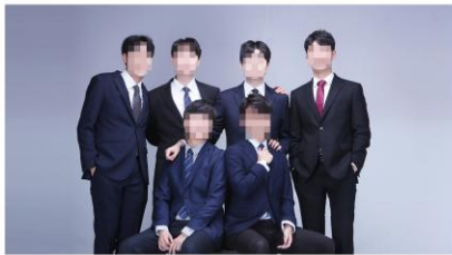
희망자에 한해 우정사진 촬영 (20~30분) 야외 또는 실내 중 선택 하실 수 있습니다. (촬영현장에서 말씀 하시면 됩니다)