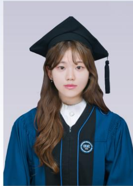
학사모 촬영 (30~40분)