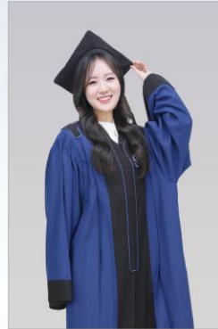
실내프로필 촬영 (20~30분)