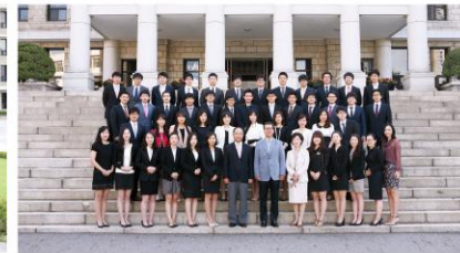
단체사진 (10~15분) 단체촬영을 희망하는 학과는 5월21일~24일 사이 학과 대표님이 카카오톡 pusannalla 으로 신청